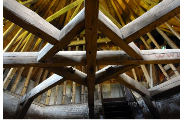
constructie toren Muiderslot

Het kan ook anders. Neem de creaties van de Amsterdamse School, neem architect Berlage als voorbeeld. Dertiger jaren woningen met puntdaken die esthetisch verantwoord- en nog altijd zeer geliefd zijn. De eerste mensen in Europa - de cro-magnon zo'n 35000 jaar geleden - woonden in grotten. Primitieve jagers die gebruik maakten van een natuurlijk dak boven hun hoofd. De huidige homo-sapiens heeft het dak werkelijk inhoud en vorm gegeven. De puntige vorm komt terug bij de tempels van de oudheid, bij huizen en kathedralen in de middeleeuwen, tot en met Vinex-wijken en villa's. Het puntdak was eigenlijk niet meer dan logica. Hemelwater, en dat komt bij ons nogal eens voor, wordt bij een puntdak direct naar de zijkanten afgevoerd. Bij een plat dak blijft neerslag, met name sneeuw, liggen. Al menig gebouw met een plat dak is in Duitsland of Oostenrijk de laatste jaren door teveel sneeuw ingestort.